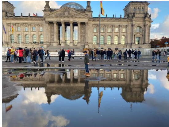
Berlijn oktober 2022