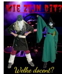
Zjee Huub 11 november 2022

Zjee Huub is zeer actief. Er zijn al drie zeer geslaagde feesten geweest voor de onderbouw. Halloween was indrukwekkend goed. Al op de parkeerplaats waren de gillende leerlingen te horen en de rij om de Halloweentour in de gymzaal te doen, kon wedijveren met de rij voor De Baron in de Efteling. Voor volgende week donderdag heeft Zjee Huub uitstekende DJ's geregeld voor het bovenbouwfeest. Ook de leerlingen van Actie Adoptie (AA) zijn zeer actief en enthousiast. Ze organiseerden de sponsorloop voor klas 1 en 2 (opbrengst meer dan € 3000,00) en de chocoladeletteractie voor het goede doel. Ook het inhuren van Sinterklaas en de pietjes is dit jaar weer van start gegaan. Oud-collega's, collega's en leerlingen haalden hiermee € 500,00 voor het goede doel op. Er hebben zich veel leerlingen uit de onderbouw aangesloten bij AA. Dat vergt nog wel het een en ander van de bovenbouwleerlingen om alles in goede banen te leiden. Maar leren gaat nu eenmaal soms met vallen en opstaan. Ze zijn goed bezig! Naast de debatclub voor de bovenbouw is er dit jaar ook een debatclub voor de onderbouw opgericht. Daar zijn we heel blij mee. Kritisch leren denken, kunnen luisteren en je mening goed kunnen verwoorden zijn belangrijke vaardigheden in de maatschappij. Ze zullen vast nog van zich laten horen.