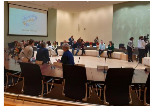
14 oktober 2022 raadzaal gemeente Nijmegen