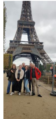
Parijs oktober 2022