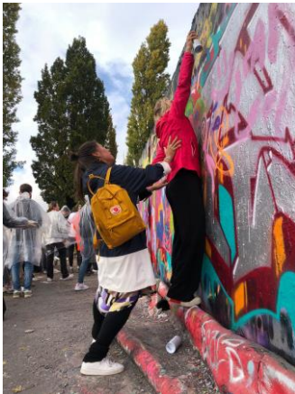
Berlijn oktober 2022